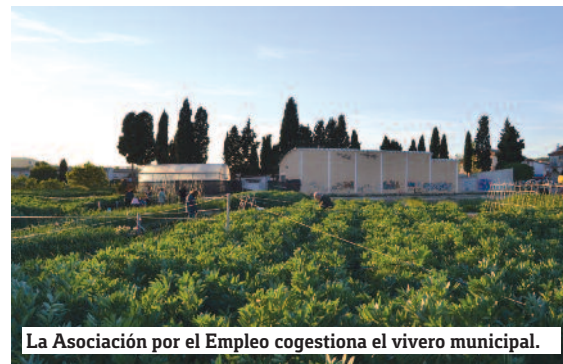
La Asociación por el Empleo cogestiona el vivero municipal.