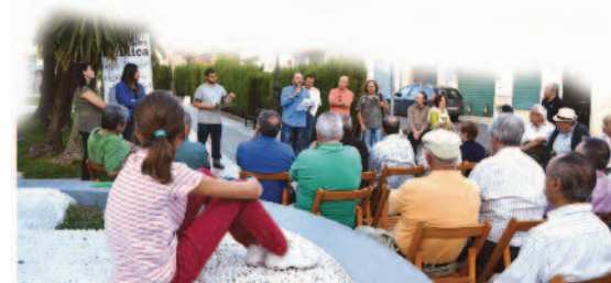
Cartel anunciador de las asambleas del otoño de 2013.

VOTA PARA ELEGIR LAS PROPUESTAS QUE QUIERES INCLUIR EN LOS PRESUPUESTOS PARTICIPATIVOS DE 2014