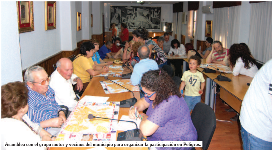
Asamblea con el grupo motor y vecinos del municipio para organizar la participación en Peligros.

Resulta imprescindible la implicación de toda la población; no se puede cambiar la realidad sin contar con quienes la construyen.