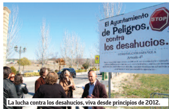
La lucha contra los desahucios, viva desde principios de 2012.